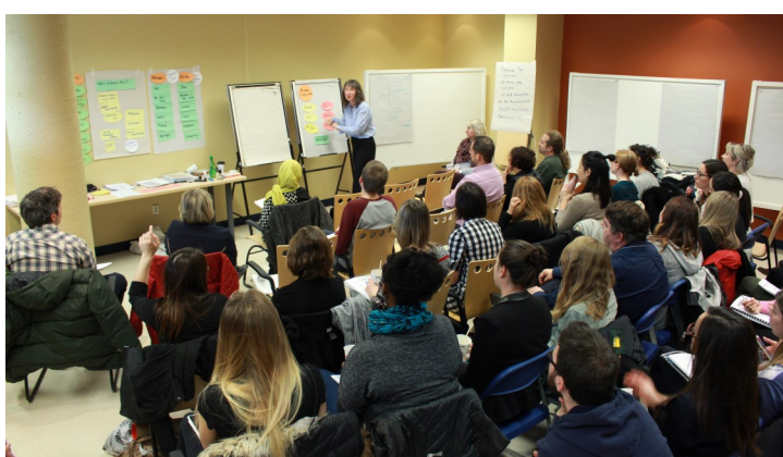
Atelier pré-Symposium « Promouvoir l'égalité des sexes en sciences »